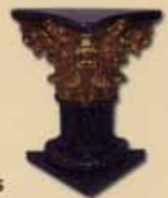
Columna de guix El capitell daurat or amb full i pintat imitant marbre

Mestre Aubert 6 08295 Sant Vicenç de Castellet Tels. 93 833 51 87 / 619 99 43 16 • rabinatcallis@hotmail.com