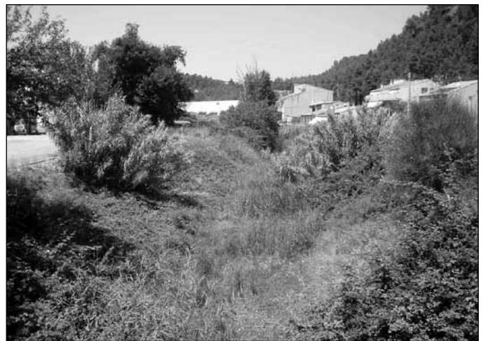
Riera abans de l'actuació

completar les millores pendents en tot l'entorn. En aquest sentit, l'Ajuntament de Sant Vicenç ha demanat noves autoritzacions als tècnics de l'Agència Catalana de l'Aigua que podrien tenir llum verda el proper mes de gener.