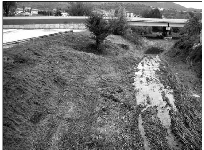
Tram de la riera on s'ha actuat