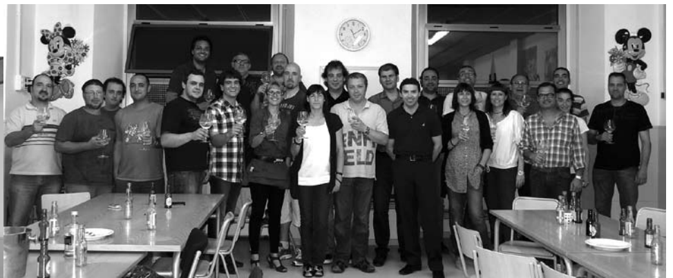
Tots els assistents amb els 2 Sommeliers

procedent del País de Gal·les, concretament a la Reserva Natural de Brecon Beacons National Park, aquesta ginebra esta feta el 100% d'herbes aromàtiques procedents dels quatre cantons